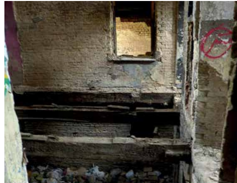
Карта та фото місця перевірки – двоповерхова покинута (недобудована) будівля, розташована за адресом м. Маріуполь, пр-т Нахімова, 156.