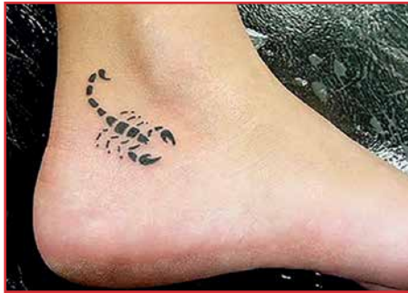
Фото № 6. Зображення татуювання на правій щиколотці невідомого трупа, виявленого 05.11.2020 на другому поверсі в недобудованій будівлі по пр. Нахімова, 156