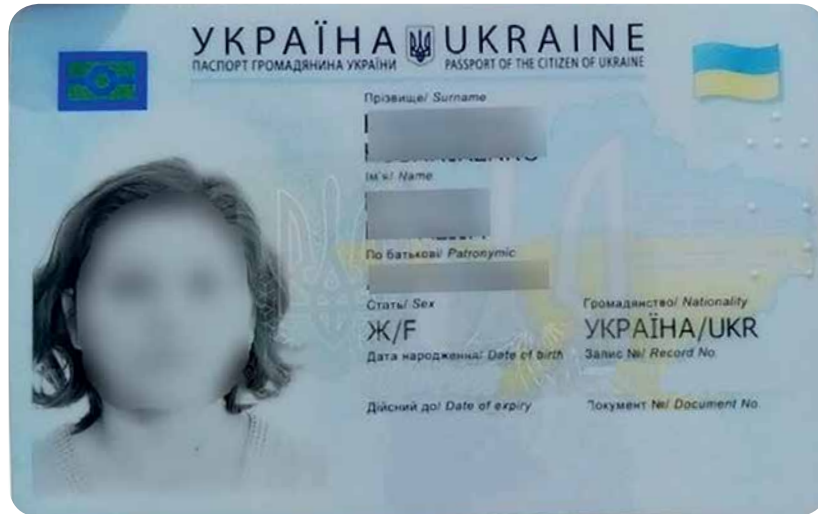
Копія паспорта гр. Іванової Т. І.