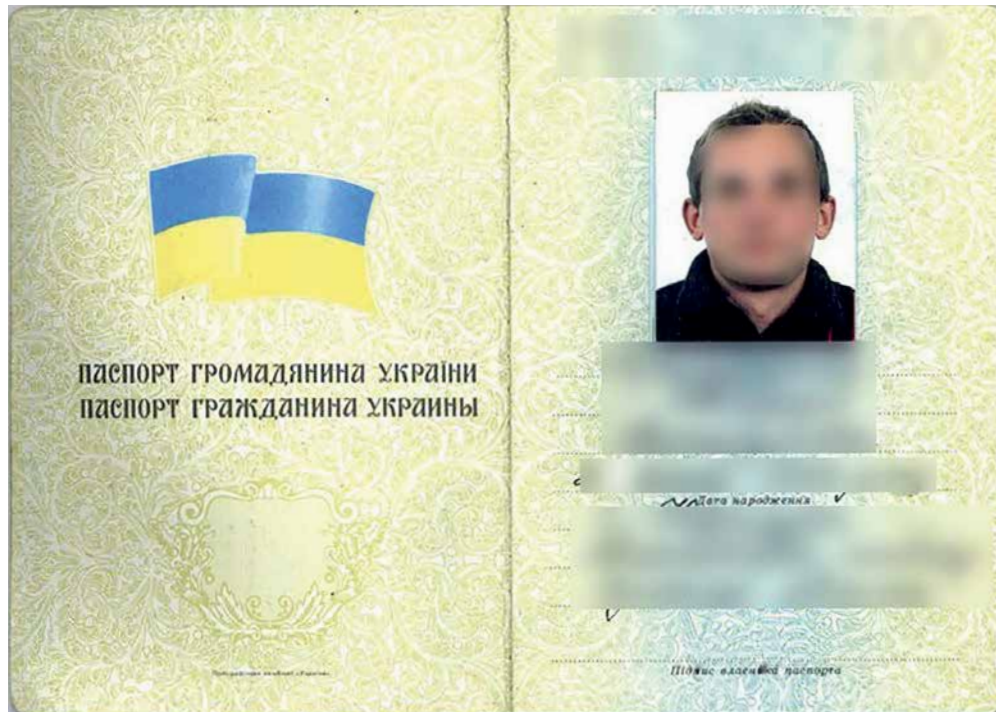
Копія паспорта гр. Іванова С. І.